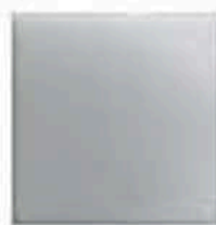
H Ceramic Streak Plate