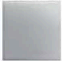
H Une plaque d'essai en céramique pour traits