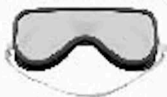
B Pair of Kids Goggles