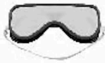
B Une paire de lunettes protectrices pour enfant