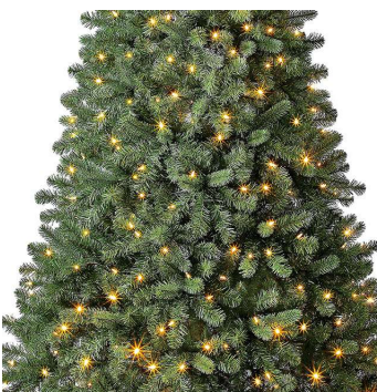
Branches en pointes