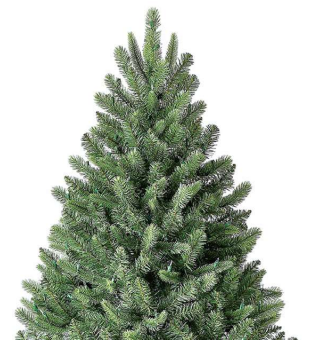
Branches en PVC