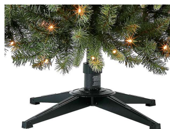
Support en métal